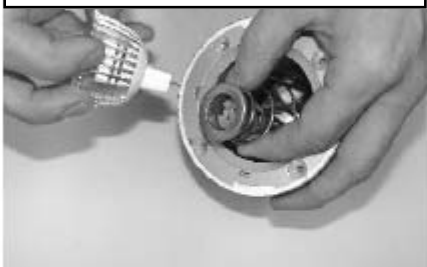
LED-entnehmen und neue anstecken.