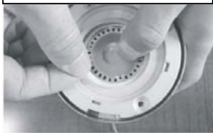
Dichtungsgummi 1 rund platzieren.