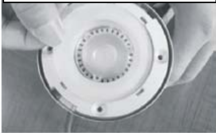
Dichtungsgummi 2 flach platzieren und danach Glasscheibe einlegen.